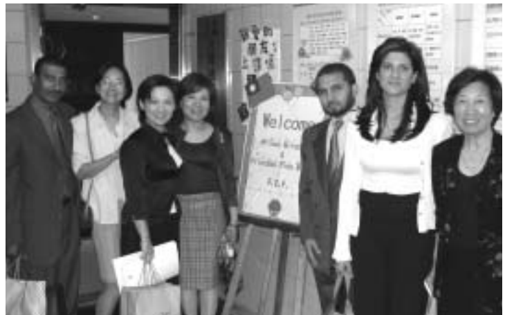
約旦親王(右三)與王妃(右二)參訪本會。