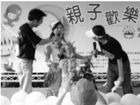
現場民眾熱情參與「親子創意蔬果造型比賽」，參賽者無不發揮最高創意，為造型加分。

台灣癌症基金會以輕鬆活潑的戶外活動，提供全民正確的癌症預防知識，除可促進親子間關係外，也讓親子共同學習健康飲食的觀念，期望將宣導觸角對象向下延伸，讓「天天5蔬果」成為全民運動，建造台灣成為健康之島。