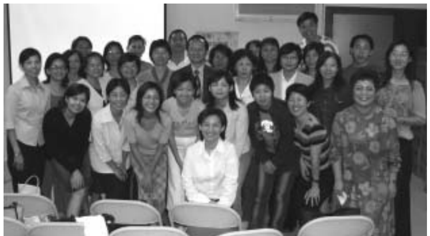
92年度志工訓練學員，在歡笑和感動中留下美好的回憶。