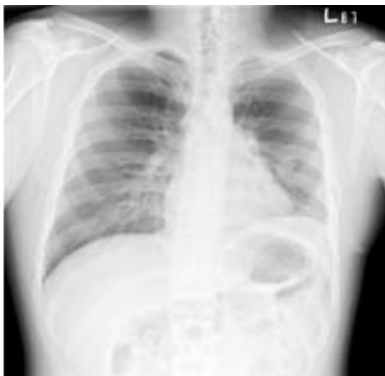
治療後 淋巴腫大 全消失