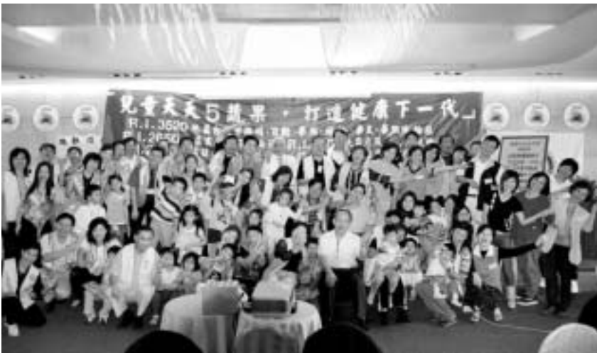
豐富的課程內容，台下民眾無不反應熱烈。

最後的結業式上，所有扶輪朋友舉起右手宣讀著「國際扶輪健康宣誓詞」，誓言為推動「天天5蔬果」健康防癌觀念而努力。領回一天的疲累所換來的「結業證書」後，「國際扶輪蔬果健康服務隊」正式成軍。期盼透過這六個扶輪社共一百二十名成員的加入，將天天5蔬果的飲食防癌目標，一步一腳印地落實於各國小中，讓「天天5蔬果」的健康觀念在孩子身上深耕，也讓台灣未來癌症的發生率及死亡率真正有效降低。