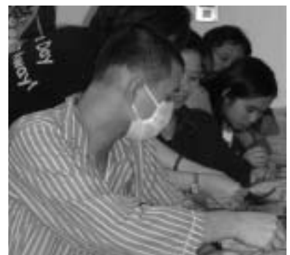
191病房癌症病患在本會志工指導下，認真學習製作卡片。

看著這些寫著各種不同主題的書籤、看著參與的病人及家屬離去時一張張帶著微笑的面容，這群在醫院圍牆內的癌症病友所面對的長期沈悶與孤單，在這個星期四午後，似乎都已得到了些許紓解。