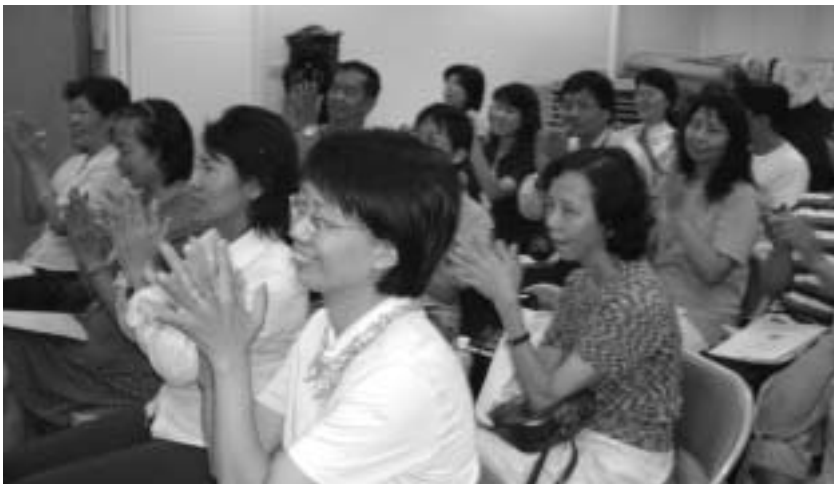
豐富的課程內容，台下民眾無不反應熱烈。

九十二年度「志工訓練課程」圓滿落幕。限額四十位額滿報名的盛況，除證明了基金會的努力獲得肯定，也展現出現代人對健康的自覺。